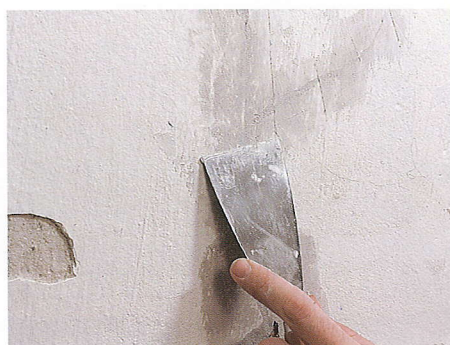
repedések, felületi hibák kitöltése