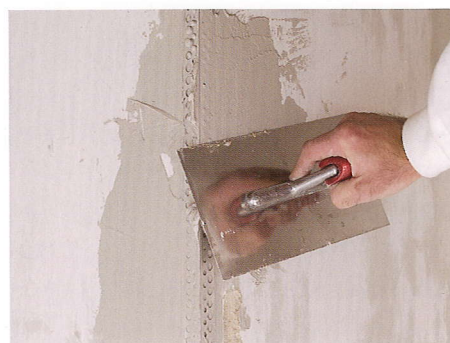
élvédő rögzítés sarokra