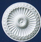
Desire (D 20) Ø 28 cm