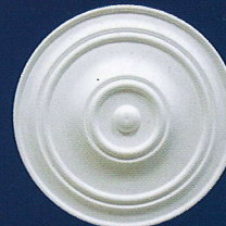
Dunja Ø 53 cm