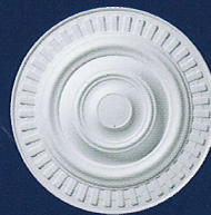
Iris Ø 43 cm