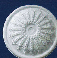
AD 23 Ø 45 cm