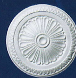
Donatella (D 55) Ø 30 cm