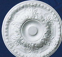
Eveline Ø 58 cm