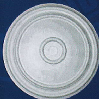
AD 21 Ø 45 cm