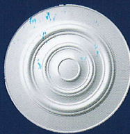
Bella (D 06) Ø 43 cm