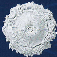
Eleonora (D 60) Ø 41 cm