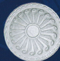
AD 24 Ø 45 cm