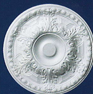
Emilia (D 100) Ø 48 cm