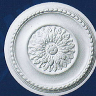
Elisa (D 65) Ø 42 cm