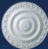
Antonia (D 04) Ø 43 cm