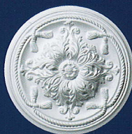
Esmeralda (D 70) Ø 45 cm