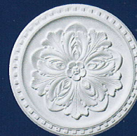
Emanuela (D 75) Ø 42 cm