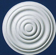
Fatime Ø 33 cm