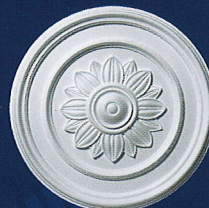
Evita (D 105) Ø 51 cm