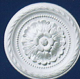
Danielle (D 40) Ø 30 cm