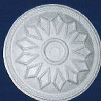
AD 22 Ø 45 cm