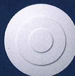
Annabelle Ø 32 cm