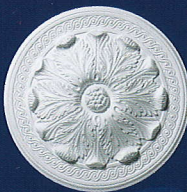
Estrella (D 90) Ø 47 cm