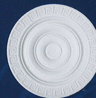
Doreen Ø 43 cm